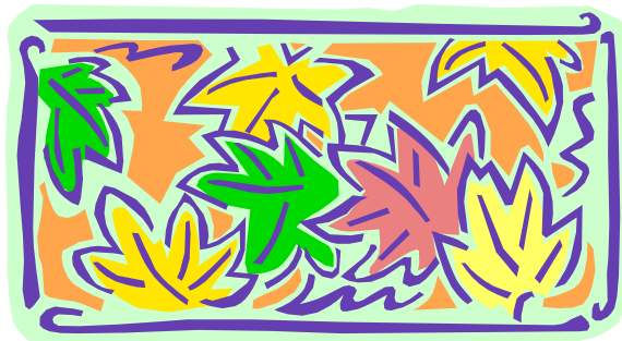
Légende accompagnant l'illustration.

terminé, vous n'aurez plus qu'à le convertir en site Web et à le publier.