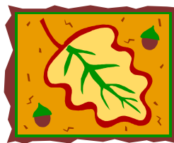
Légende accompagnant l'illustration.

L'image que vous choisirez devra être placée près de l'article et accompagnée d'une légende.