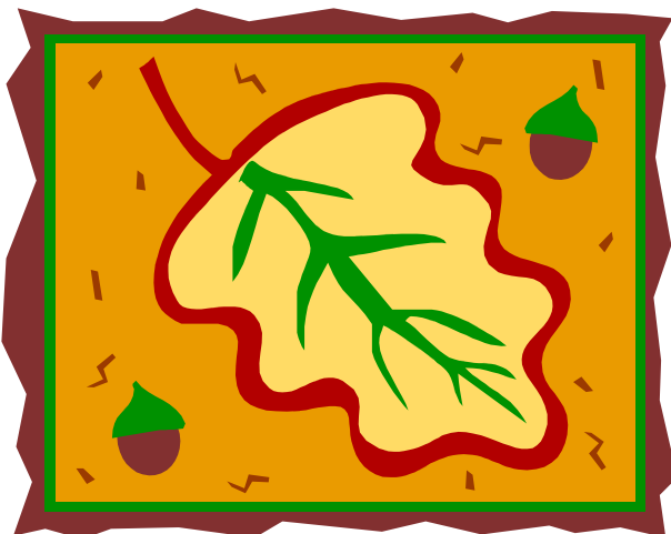
Légende accompagnant l'illustration.

S'il reste de la place, vous pouvez insérer une image clipart ou un autre graphisme.