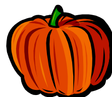
Légende accompagnant l'illustration.

L'image que vous choisirez devra être placée près de l'article et accompagnée d'une légende.